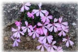
ピラジが沢山咲いていました