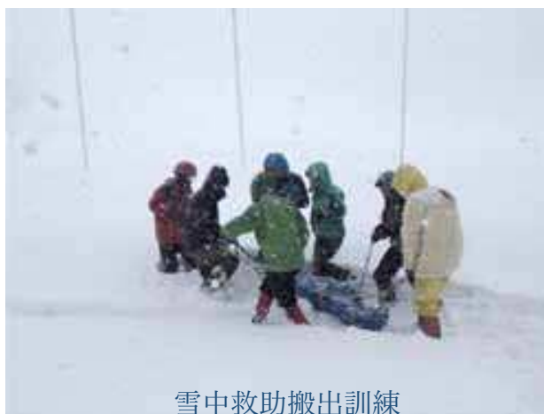
雪中救助搬出訓練

近年の登山事故を見ると、中央山岳はもとより、中国地方の山々、広島県内の山においても多くの遭難事故が起こっています。有名山岳地帯の事故は優秀な現地警察や救助組織に任せれば良いでしょう。県内の登山事故も救助そのものはヘリコプターによるピックアップが普通に行われ成果を上げています。しかし捜索に関しては山域は複雑で分かり難く各山域に詳しく捜索に携われるのはいつも登山している我々では無いでしょうか。