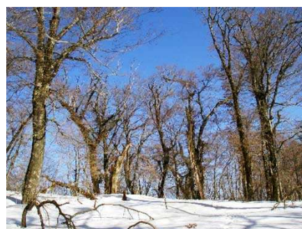
幕営予定地付近のブナ林

後冠山を中心とした大沼が原を取り巻く雪の三山!「冠山、広高山、寂地山」はほんとにきれいでその中に身を置ける今回の計画は登山技術だけでなく素晴らしい自然に抱かれる充実を感じる事が出来ると思います。救助隊関係者だけでなく雪山歩きや雪山生活である幕営山行に興味のある方はぜひご参加ください。心配な事があれば私までお聞きください。